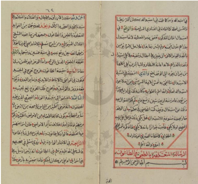
صورة الورقة الأولى من نسخة المكتبة الأزهرية