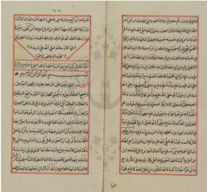
صورة الورقة الأخيرة من نسخة المكتبة الأزهرية